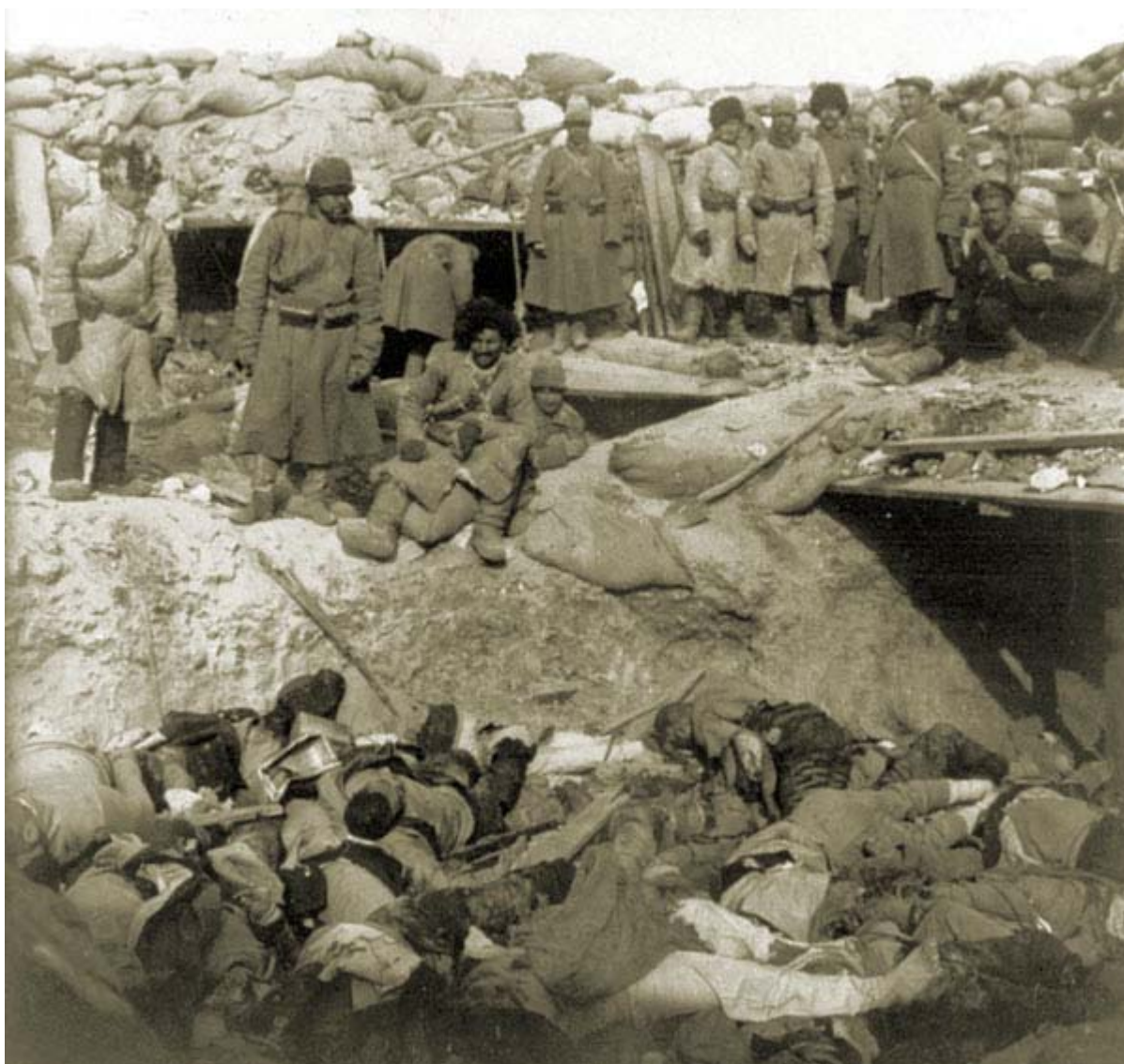
Убитые японцы, после очередного штурма Порт-Артура. Во время осады крепости, которая длилась 329 дней, японцы потеряли убитыми и ранеными до 110 000 человек. Из 42 000 защитников крепости уцелело только около 25 000.

Так что распространившаяся с легкой руки Витте версия о том, что японские потери превосходили русские, оказалась мифом. Это же относится и к разговорам председателя Совета Министров, в которых он убеждал собеседников в теоретическом успехе стратегии истощения: если бы не революция 1905 года, Россия якобы поставила Японию на колени. На самом деле Россия понесла урон в живой силе ничуть не меньше Японии, хотя резервный потенциал Петербурга значительно превосходил тот, которым располагал Токио. О том, что ни та, ни другая из воюющих сторон не чувствовала себя в силах продолжать борьбу, свидетельствовали тайные попытки как Японии, так и России еще до начала диалога в Портсмуте наладить контакты через третьи страны и начать переговорный процесс.