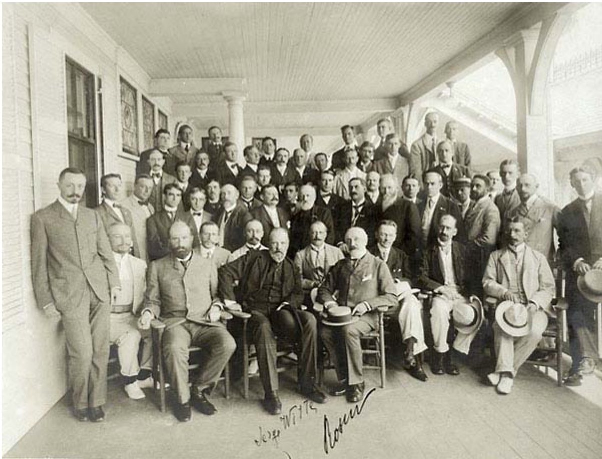
Сергей Витте среди американских журналистов во время переговоров в Портсмуте. Благодаря частому общению со СМИ (в отличие от японцев) Витте удалось склонить американскую общественность на свою сторону.

Современные историки оспаривают принятое в советской историографии число потерь в Русско-японской войне