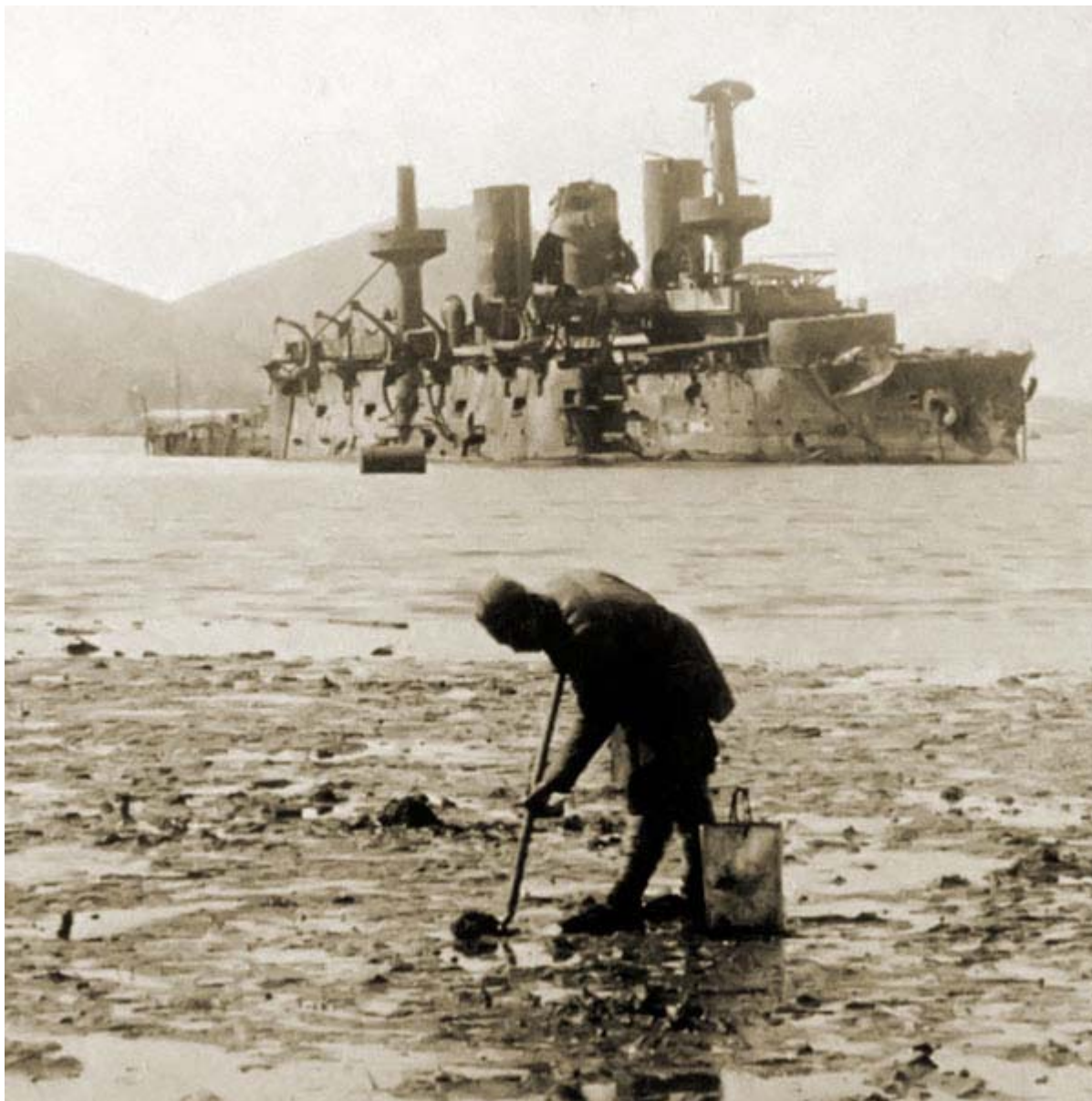
Броненосец «Пересвет», взятый в плен японцами после Цусимского сражения. Всего в Цусимском бою участвовало 38 русских судов, 21 из которых были затоплены, а 7 отбуксированы в японские порты.

Почти все требования Японии были удовлетворены. Согласно договору Россия признавала Корею сферой японского влияния, уступала стране самураев арендные права на Ляодунский полуостров с Порт-Артуром и Дальним и часть ЮМЖД от Порт-Артура до Куаньчэнцзы. Она также соглашалась на заключение выгодной японцам конвенции о рыбной ловле вдоль русских берегов Японского, Охотского и Берингова морей. Помимо прочего, Токио передавался Южный Сахалин до 15-го градуса северной широты с прилегающими островами, правда, без права строить там укрепления. Петербург заплатил за содержание русских военнопленных, за вычетом средств, что были им потрачены на японцев, оказавшихся в русском плену (около двух тысяч человек). Русские и японские войска одновременно покидали Маньчжурию.