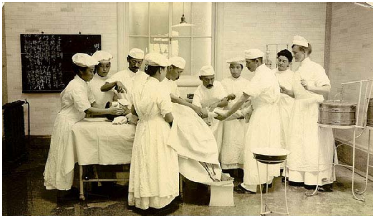
Среди японских фельдшеров в 1904–1905 годах работали и врачи из США, так как многие американцы считали, что конституционная Япония борется с абсолютистской Россией за свободу Кореи и Китая.

Что касается японских потерь, то, по официальным данным императорской медицинской службы, на 1 мая 1905 года они составили 43 892 человека, убитых на поле боя, 9 054 умерших от ран и 11 990 умерших от болезней и несчастных случаев. Всего в госпитали поступило 145 527 раненых и 173 121 солдат, ставших жертвами болезней и несчастных случаев. После 1 мая потери японцев убитыми увеличились примерно на сто человек, погибших во время высадки десанта на Сахалин, плюс 117 матросов, отдавших жизни за микадо в Цусимском сражении. За время с 1 мая и до заключения Портсмутского мира от ран и болезней скончалось еще некоторое число военнослужащих. Число умерших от болезней обычно оценивают в 2/7 от числа умерших в период до 1 мая, то есть около 3 400 человек. В свою очередь, число умерших от ран после 1 мая вряд ли превышало 1 000 человек. Тогда общие безвозвратные потери Японии можно оценить примерно в 69 553 погибших.